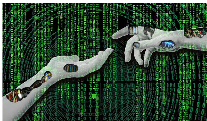
Los repositorios, esas ventanas abiertas al mundo donde acceder y visualizar los contenidos generados por una comunidad

Cuando el open access sonaba a “ciencia ficción”, algunos creímos en él y eso puso en marcha esta evolución en la que nos encontramos. En dicha evolución no solo cuentan las fuerzas propias de la institución sino que hay otras externas que también mueven los hilos, hablo de las políticas nacionales e internacionales en favor del acceso abierto, y también de otras instituciones no dedicadas a la investigación pero que juegan un papel importante en la preservación del patrimonio histórico, de las sociedades científicas, o de las agencias que financian la investigación.