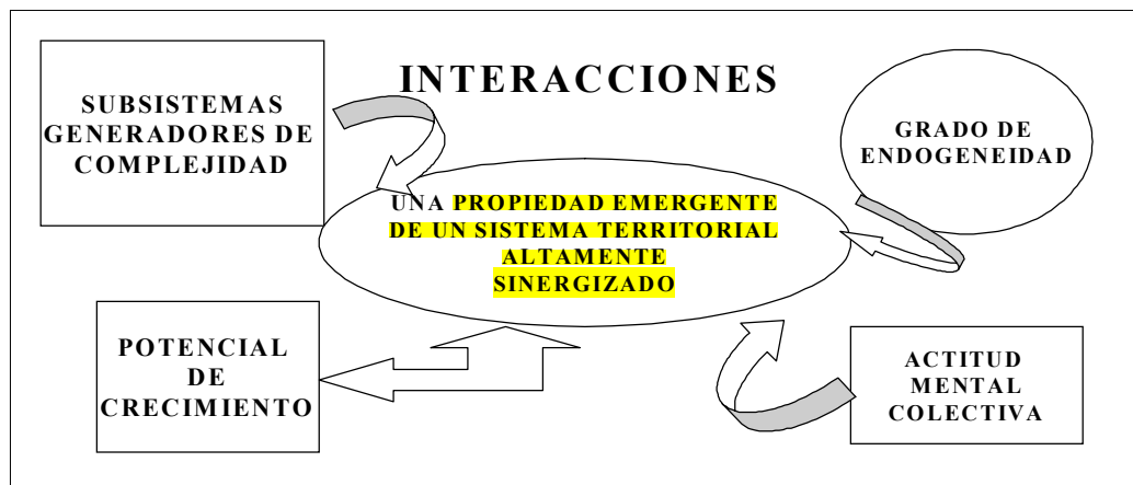
Figura 4. Desarrollo territorial endógeno.

Pero lo más importante mostrado por la Figura 4 tiene que ver con los conceptos de subsistemas generadores de complejidad y con el de capital intangi-