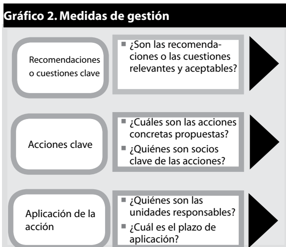
Gráfico 2. Medidas de gestión

El Anexo 7 incluye una plantilla para las medidas de gestión. La plantilla busca facilitar la preparación de las medidas. Se puede utilizar un cuadro de comentarios en la plantilla para destacar las lecciones de la experiencia de la evaluación, las reacciones a los hallazgos y las cuestiones que no sean abordadas directamente mediante recomendaciones clave o cualquier otro punto que la unidad encargada y los interesados consideren importantes para registrar.